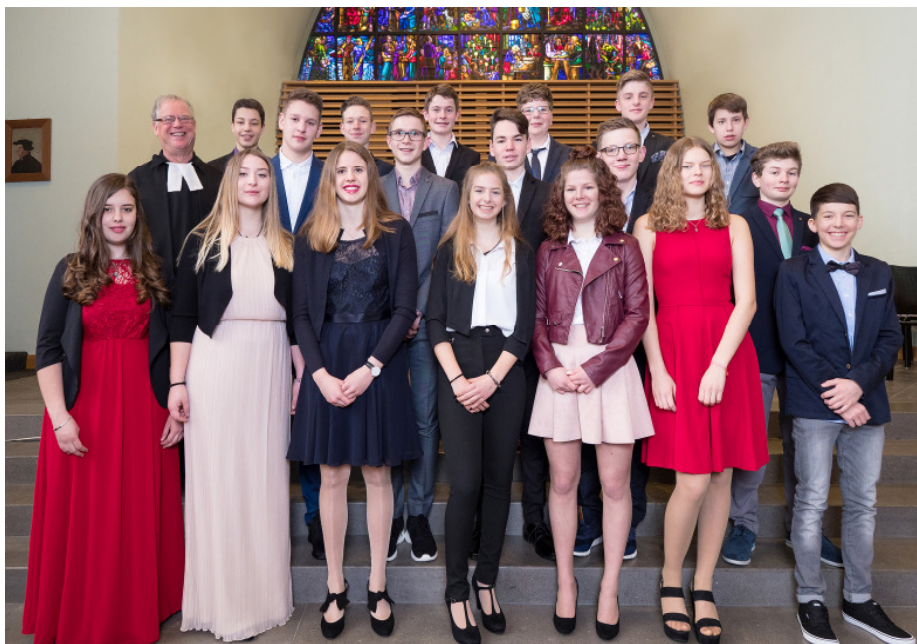
Konfirmation am Palmsonntag, 25. März